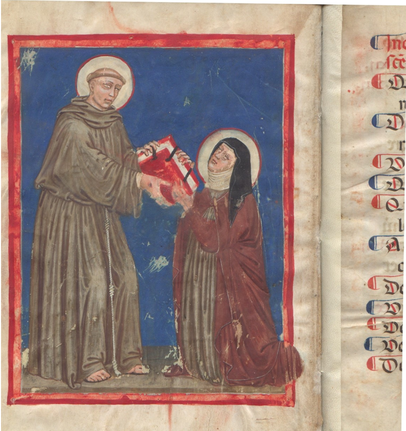
Franziskus übergibt Klara die Regel ( Miniatur aus dem Codex des Klosters Novaglie )