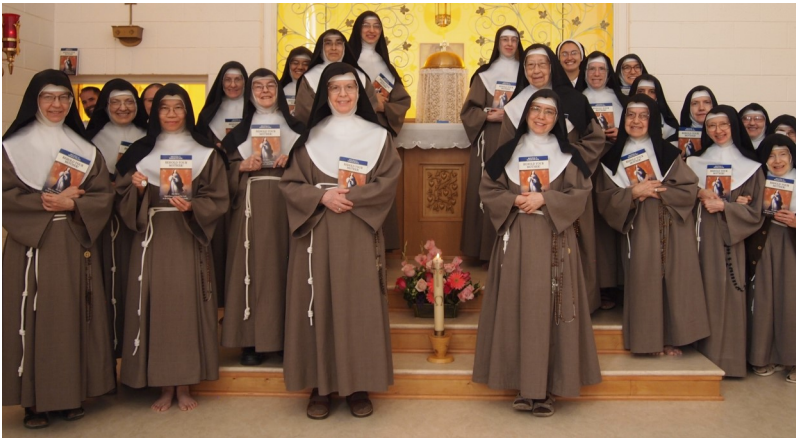
Die Gemeinschaft 2020 am Tag der Weihe bei der Miliz der Unbefleckten

Eure Schwestern aus Roswell (USA) monastery@poorclares-roswell.org