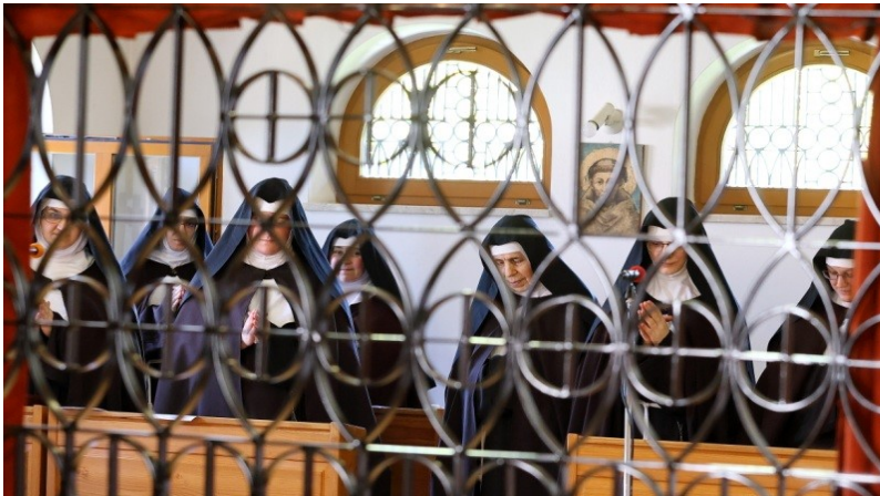
Die Schwestern in Nazarje