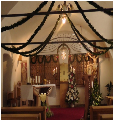
Turnišče – Kapelle

Die spirituellen Gaben Gottes übertrafen sogar seine materielle Fürsorge für uns. Der Herr füllte das Kloster bald mit neuen Schwestern. 1994, zum Abschluss des Jubiläumsjahres zum 800. Geburtstag der hl. Klara, bestätigte der Heilige Stuhl die kanonische Errichtung des neuen Klosters. Im Jahre 2000 waren wir so viele, dass wir wie mystische Bienen waren, wie uns der Erzbischof von Ljubljana, Msgr. Franc Rodé, nannte. Genau zum 700.