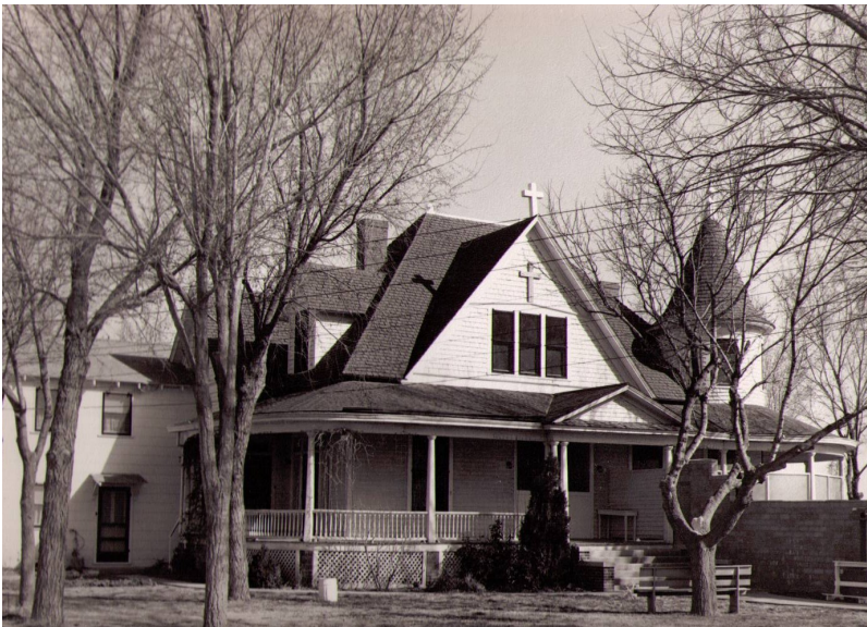
Das Kloster in Roswell 1948