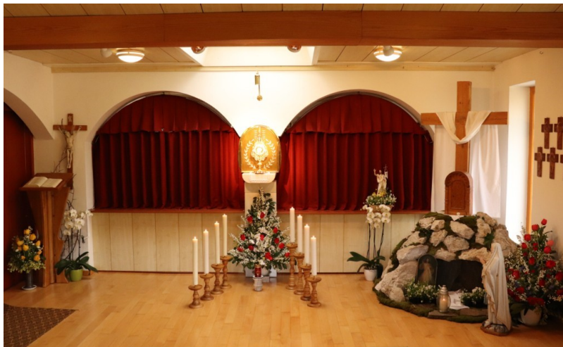
Kapelle der Schwestern