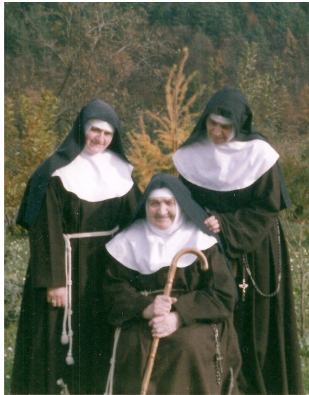
Nazarje 1986 – die ersten Schwestern