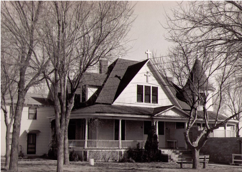
Le monastère de Roswell en 1948