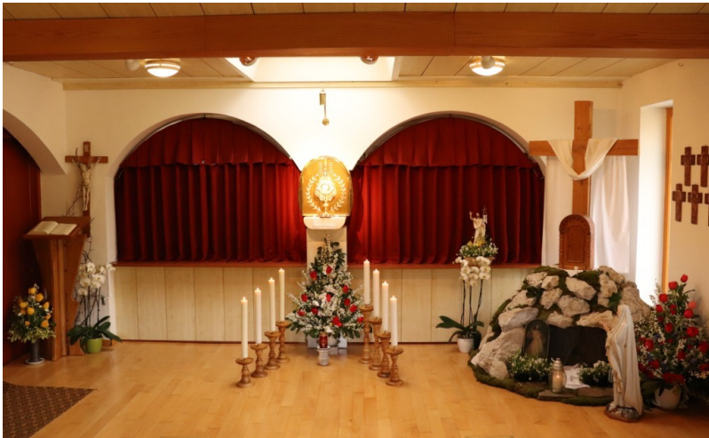
Nazarje: la chapelle des sœurs