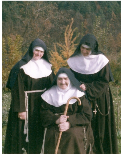
Nazarje 1986 Les trois premières sœurs