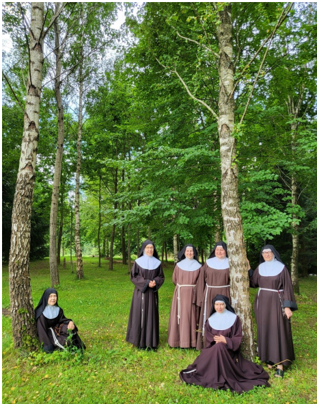
Die Klarissen in Kretinga, Litauen osc.lituania@gmail.com

Diese Inbrunst des Geistes entspricht im hl. Franziskus vollkommen seiner Demut, er ist ein Minderbruder, der in der Lage ist, die ganze Schöpfung mit Dankbarkeit und Achtung aufzunehmen.