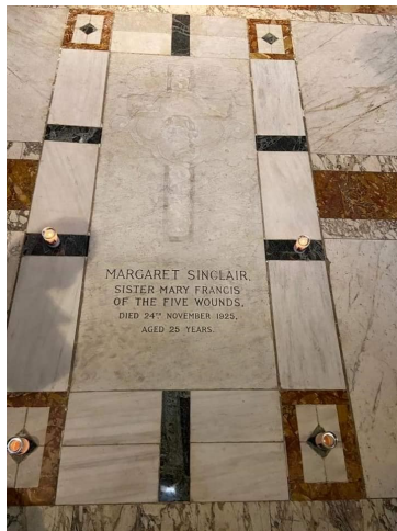
Tombe de la Vénérable depuis 2003 dans la Cathédrale St. Patrick à Edimbourg