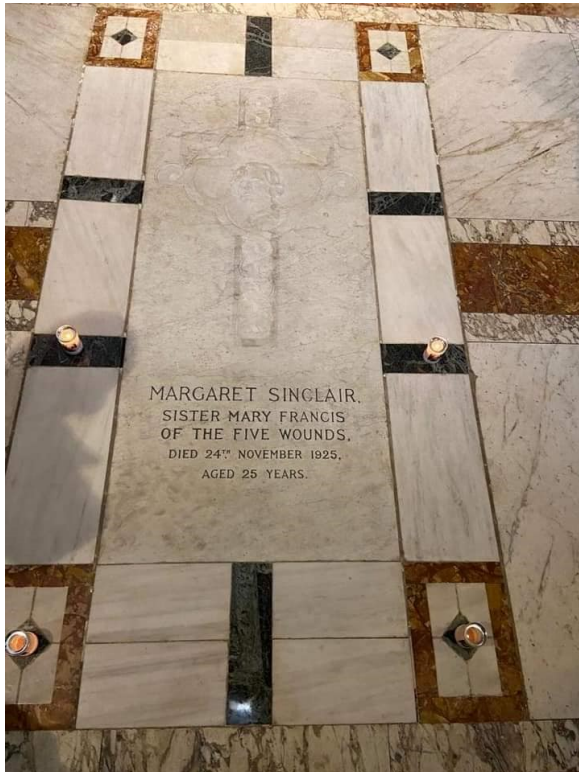
Túmulo da Venerável desde 2003 na Catedral de São Patrício em Edimburgo

25 de outubro 2003: Traslado dos restos mortais para a Igreja de São Patrício em Edimburgo, na Capela da Ressurreição.