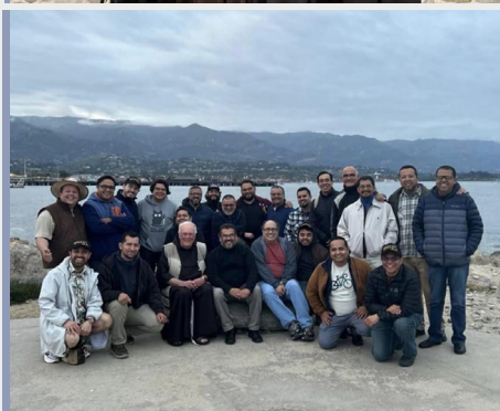
Spotkanie braci "under 10" w Kalifornii (USA) z prowincji św. Junipero Serry, Meksyk.