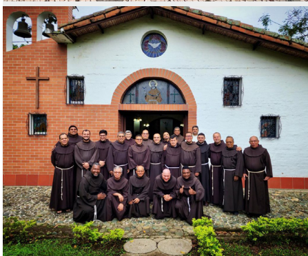
Dzień skupienia w Kolumbii.