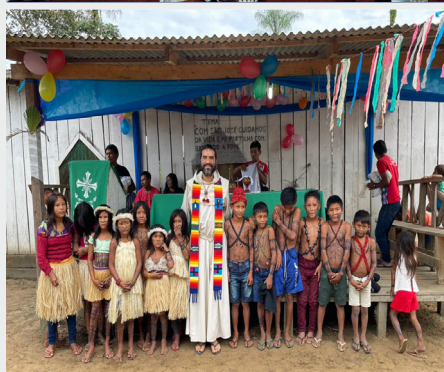
Misja São Francisco in Rio Cururu, Kustodia św. Benedykta w Amazonii.