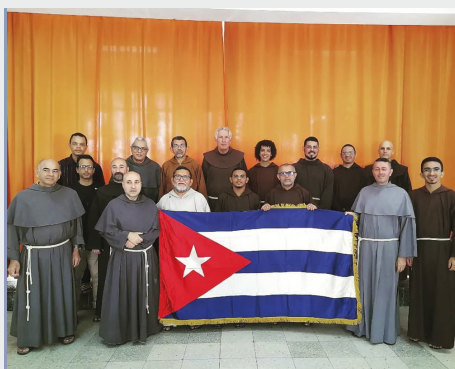
Retiro inter-obediencial de frailes de la I Orden, en Cuba