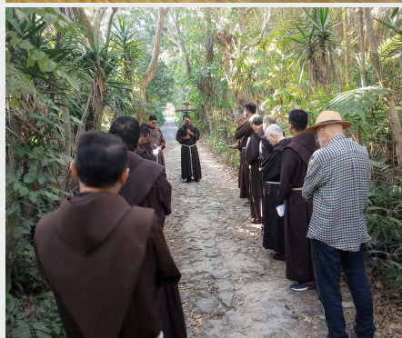
Encuentro Espiritual de hermanos en el Salvador