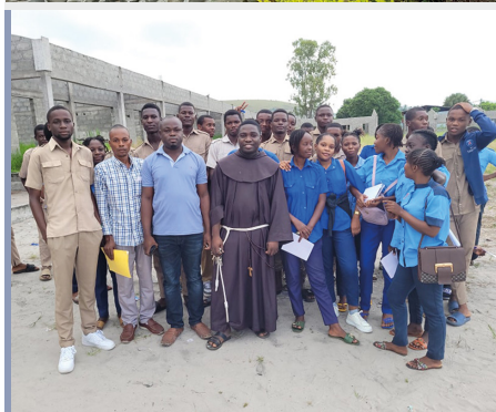
Escuela Santa Clara en Djiri, Congo Brazzaville