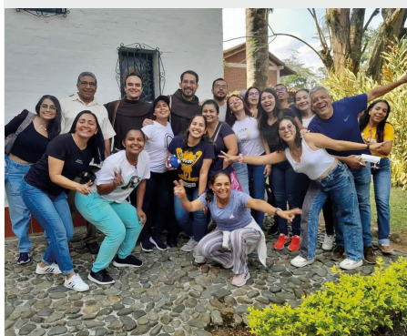
Colegio Franciscano Fray Damián González, Colombia