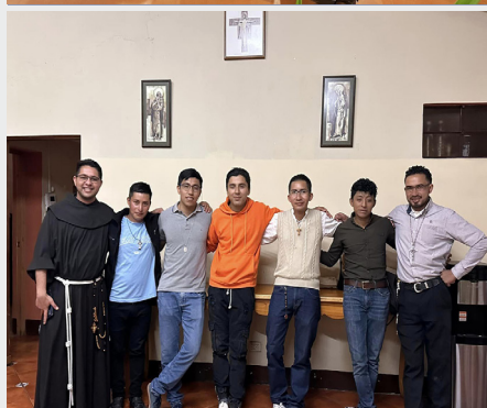
Vivre ensemble des aspirants au Guatemala