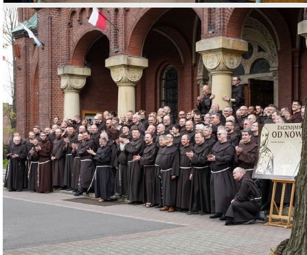
Chapitre des Nattes de la Province de l'Assomption de la BVM, Pologne