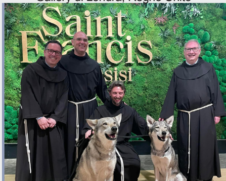
Inaugurazione della mostra su S. Francesco d'Assisi nella National Gallery di Londra, Regno Unito