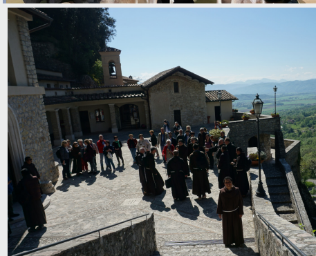
Passeio e formação permanente da fraternidade da Cúria Geral em Fonte Colombo, Itália