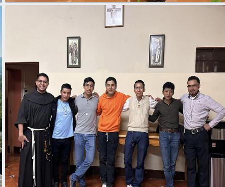
Convivência dos Aspirante na Guatemala