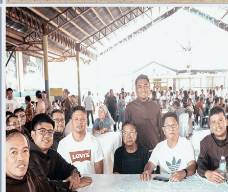
Nueva misión franciscana en Tondod – San José (Filipinas)