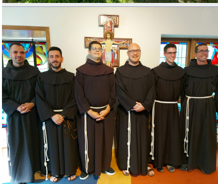
Ingreso de novicios al Noviciado internacional en Killarney (Irlanda)