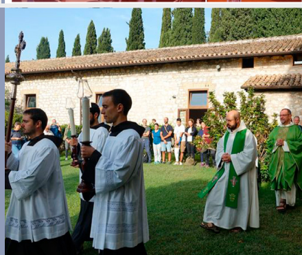
Święto „Pieśni Słonecznej u św. Damiana (Italia)