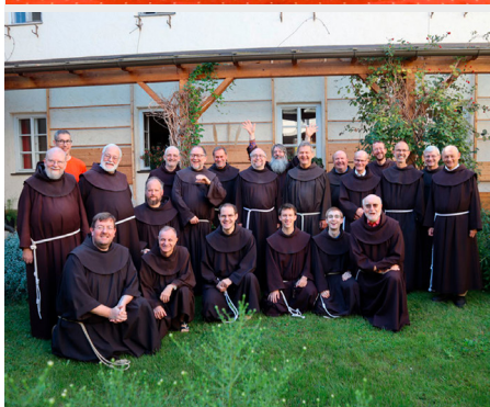
Kapituła w kustodii Chrystusa Króla (Szwajcaria)