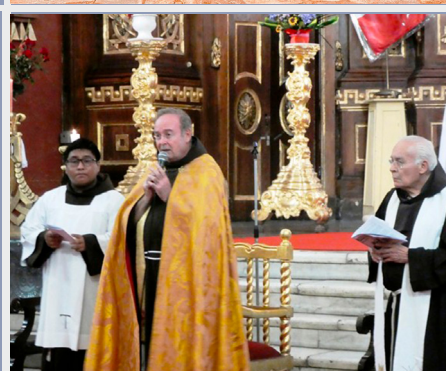
Uroczysta Msza św. Z okazji 800-nej rocznicy Bożego Narodzenia w Limie.

jako życiowy wybór, podzielili się z nami swymi uczuciami i krokami przemierzonymi w życiu. Wypowiedział się mody brat, odbywający formację, kilku młodych którzy dokonali wyboru na rzecz projektów ekologicznych i troski o ziemię; inni którzy wykonując swoje zawody wybrali posługę na rzecz uzależnionych w ubogich dzielnicach, inni młodzi towarzyszą rodzinom zagrożonym współczesnymi formami patologii społecznych albo którzy są aktywni na polu troski o ofiary przestępstw oraz w obronę praw i zapewnienia bezpieczeństwa dzieciom.