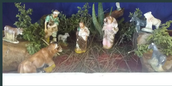
St Theresa- Driefontein church