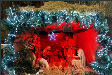
Franciscan Friary - Killiney Co Kerry - The International Novitiate