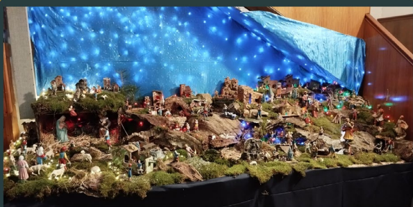
Convento S. Francesco alla Verna - Loricca (CS)