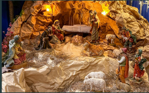
Curia Generale OFM