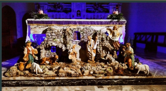
Convento Santa Maria delle Grazie di Leverano (LE)