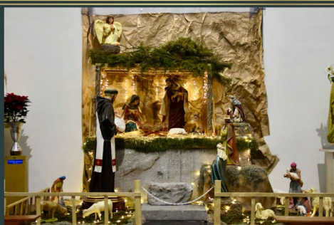
Parroquia Santiago Apóstol Tlatelolco - Ciudad de México