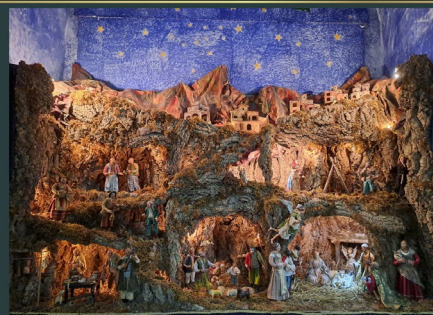
Convento e Chiesa SS.ma Annunziata - Vitulano (BN)