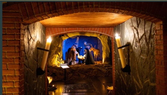
St John's Cathedral in Den Bosch - the Netherlands