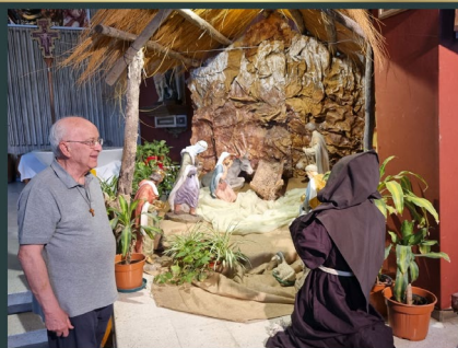
Parroquia San Francisco de Asis de San Juan - Argentina - Prov. Franciscana San Francisco Solano