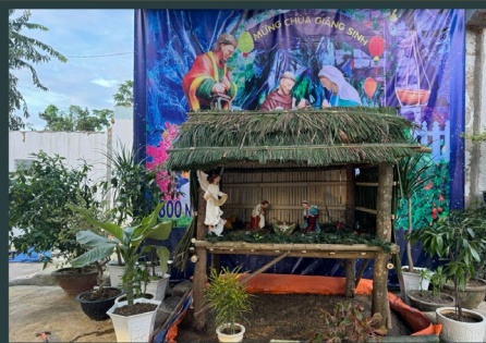
Nativity scenes in Vietnam