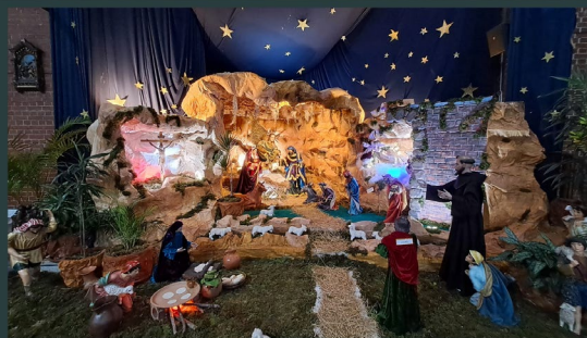
Parroquia Inmaculado Corazón de María Z 12 Guatemala