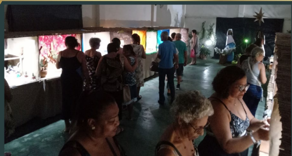
Paróquia São Francisco de Assis Duque de Caxias - RJ - Brasil