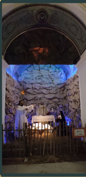
Chiesa San Pasquale Baylon Foggia