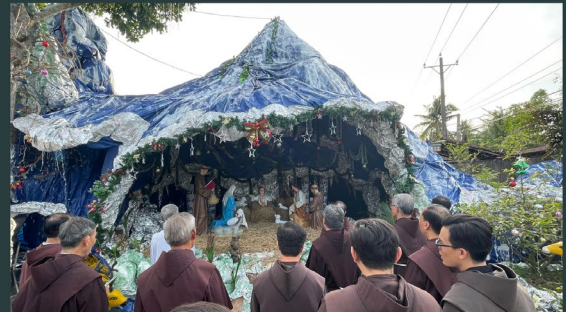
Ân Phúc community in Vietnam