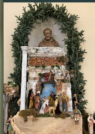
Convento S. Francesco d'Assisi (Reggio Calabria)