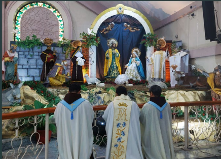
Real Monasterio de Santa Clara de Manila - Quezon City - Philippines