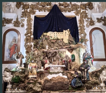
Convento S. Antonio - Terranova da Sibari (CS)