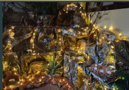
Noviciado Franciscano - Lagoa Seca - Paraíba - Brasil