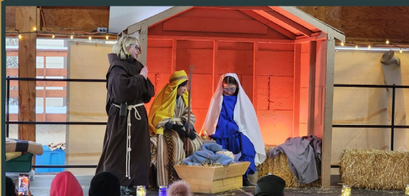
Mount St Francis Retreat Centre - Cochrane Albert - Canada