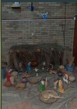
Ascension Church - Nyolohelo South Africa