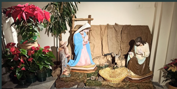
Santuario S. Umile - Bisignano (CS)