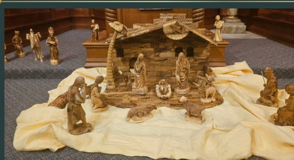
Friary Chapel in Southfield, Michigan USA