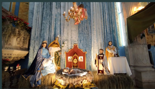
Parroquia La Purísima Concepción - Etzatlán, Jalisco, México