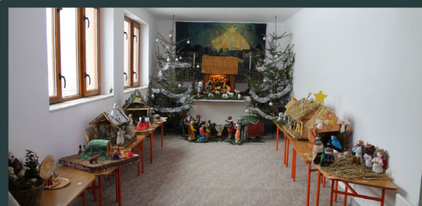
Esztelnek - Friars Minors of Transylvania in Romania