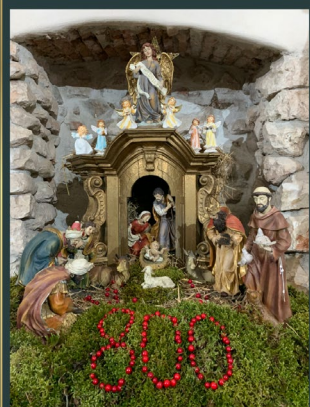
Convento San Giovanni Battista Braşov - Romania