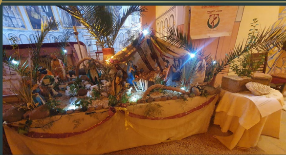
Pastorale sociale della Parrocchia dei Santi Martiri del Marocco - Marrakech