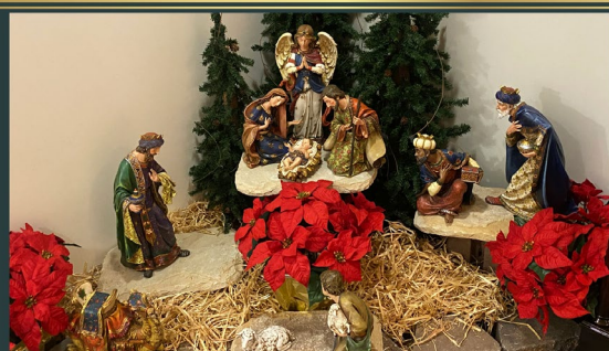
Provincial Curia Immaculate Conception - USA