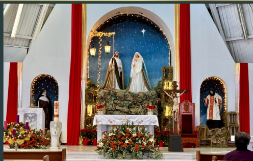
Fraternidad San Felipe de Jesús en México