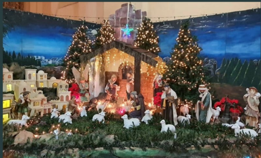
Catedral de Comayagua Honduras