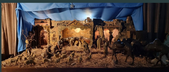
Kolozsvár - Friars Minors of Transylvania in Romania