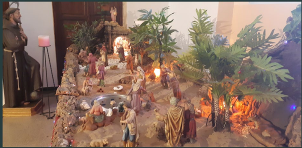
Rabat - Morocco