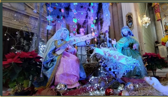
Templo de San Francisco de Asis Querétaro - México