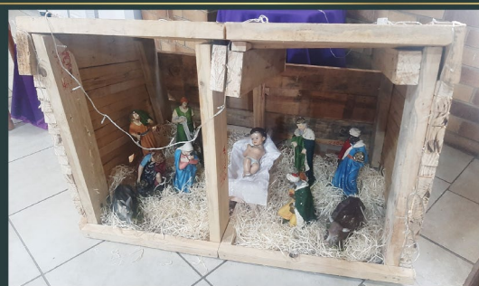
Crib of St. Joseph the Worker, Boipatong -South Africa