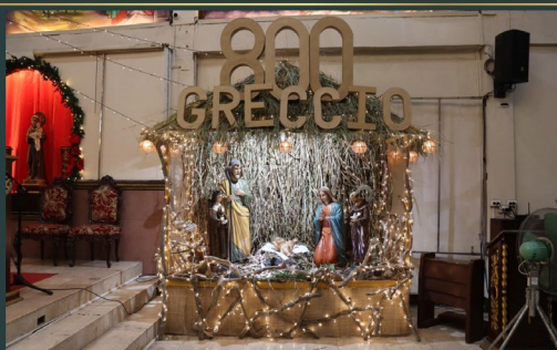
St. Joseph Parish - Philippine