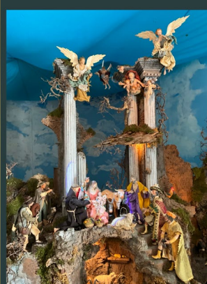
Convento SS Ecce Homo di Mesoraca (KR) - Calabria