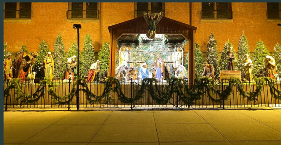
St Anthony Parish along St New York City - Houston - IC Province