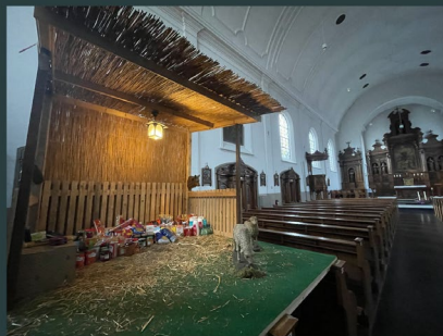
City convent San Damiano in 's-Hertogenbosch - The Netherlands