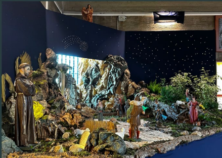
Convento S. Antonio - Commenda di Rende (CS)