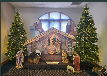
Church of the Transfiguration in Southfield - Michigan USA