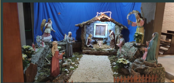
Convento S. Maria della Misericordia - Casalbore