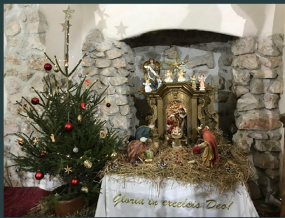
Brassó - Friars Minors of Transylvania in Romania