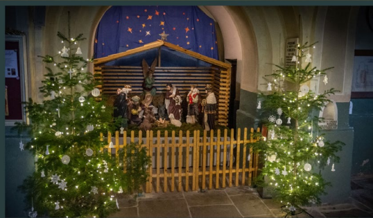
Csiksomlyó - Friars Minors of Transylvania in Romania