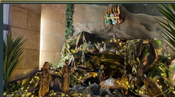
St. Anthony of Padua Latin Parish - Jaffa, Tel-Aviv - Terra Santa