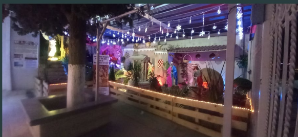
Parroquia de Ntra Sra del Carmen, en Delicias Chihuahua en México