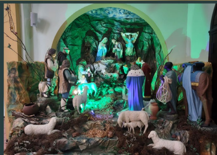
Igreja Convento Santo Antonio - Lagoa Seca - Paraíba - Brasil