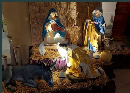
Chiesa dedicata a Santa Maria degli Angeli a Bahar ic-caghaq (Malta)