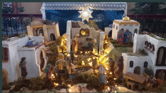
Iglesia Inmaculada Concepción de la Purísima Virgen María - Tartu - Estonia