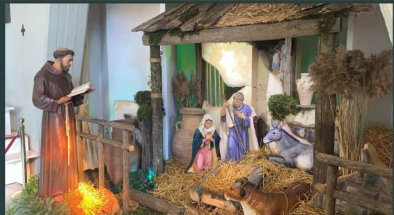
Convento Cuore Immacolato di Maria - Avellino