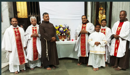
Our Lady of Good Counsel Church Sion Mumbai