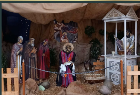
Parrocchia Francescana di Latina - Italia