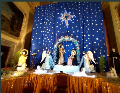
Convento de San Francisco de Asis, en la ciudad de Irapuato Guanajuato México