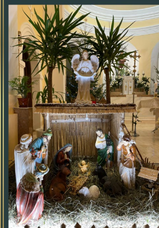
Déva - Friars Minors of Transylvania in Romania