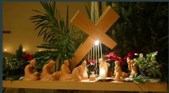
Chiesa del convento di Görnitz in Germania