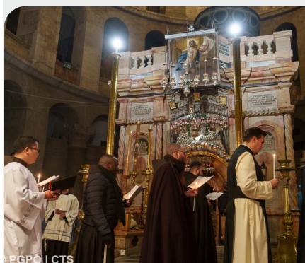
Seconde veille pour le Carême au Saint Sépulcre (Custodie de Terre Sainte)