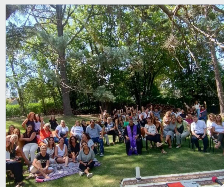
Rencontre des Communautés éducatives de la Prov. St François Solano (Argentine)