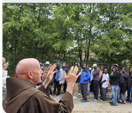
Franjevačko služenje potrebitima, Provincija BDM Guadalupske (SAD)