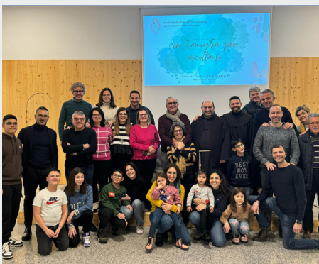
Obiteljski pastoralni susret, provincija Uznesenje BDM (Italija)