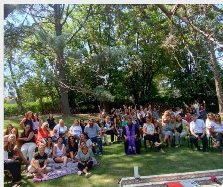
Encontro das Comunidades Educativas da Prov. S. Francisco Solano (Argentina)