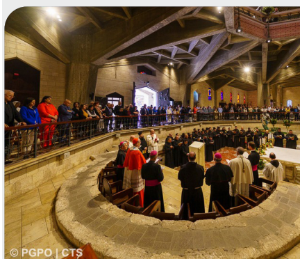
Solemnidad de la Anunciación del Señor celebrada en Nazaret (Tierra Santa)