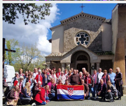
Peregrinación "Siguiendo las huellas de San Francisco", Prov. Ss. Cirilo y Metodio (Croacia)