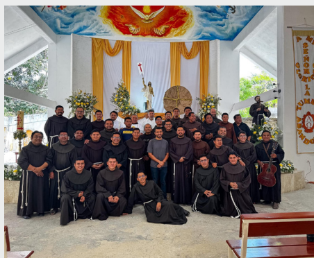
Capítulo de las Esteras en la Prov. San Felipe de Jesús (México)