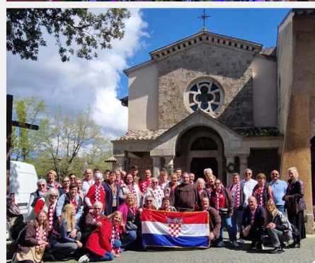
Pèlerinage "Sur les traces de St François", Prov. Ss. Cyrille et Méthode (Croatie)