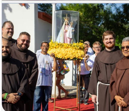
Frères en formation initiale, Fête de Notre Dame de la Penha dans la Prov. Immaculée Conception (Brésil)