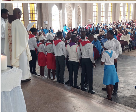
Célébration du Dimanche de la Divine Miséricorde au Zimbabwe ( Boni Pastoris Custodia )