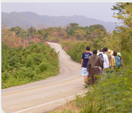
Jornada Mundial Jornada Mundial del Refugiado 2024 (Asia y África)