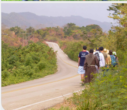
Svjetski dan izbjeglica 2024. (Azija i Afrika)