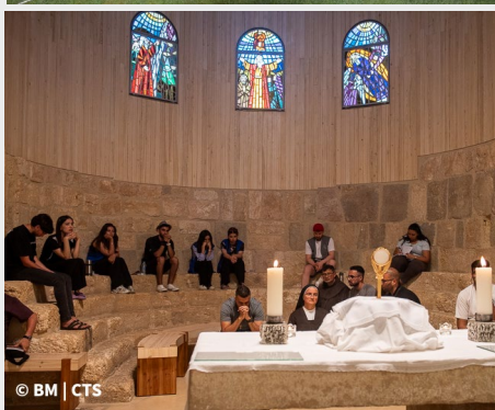
10. franjevački hod u Jordanu na gori Nebo (Sveta zemlja)