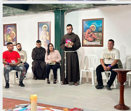
I. provincijski katehetski susret – provincija San Pablo Apostol – Kolumbija