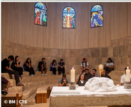
10º Caminhada franciscana na Jordânia, no monte Nebo (Terra Santa)