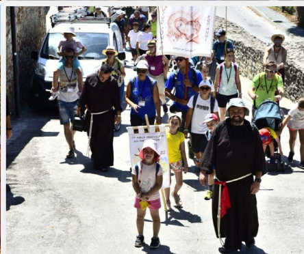
Marcha de la Familia Franciscana, Provincia Seráfica de San Francisco de Asís (Italia)