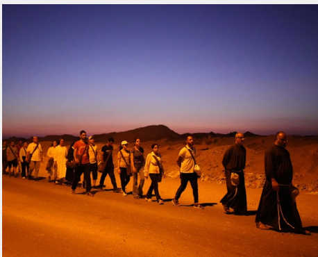
Marcha franciscana en Egipto, Provincia de la Sagrada Familia