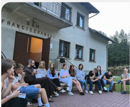
Retiro con 29 jóvenes en Dukla, Provincia de la Inmaculada Concepción (Polonia)