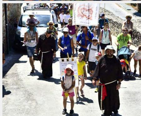
Marche franciscaine des familles, Prov. Séraphique S. Francesco d'Assisi (Italie)