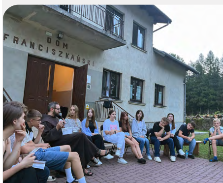
Retraite avec 29 jeunes à Dukla, Prov. Immaculée Conception (Pologne)