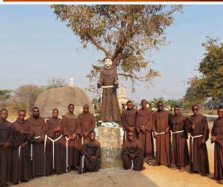
Première profession des novices de la Fondation Immaculée Mère de Dieu (Angola)