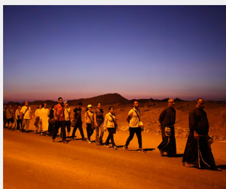
Marche Franciscaine en Égypte, Prov. Sainte Famille