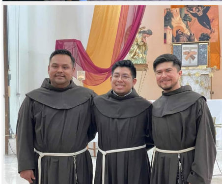
Završetak kanonskog mjeseca, provincija Sveti Filip od Isusa (Meksiko)