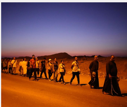
Franjevački hod u Egiptu, provincija Sveta obitelj