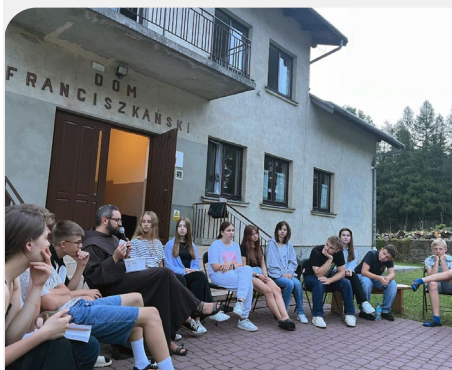
Duhovna obnova s 29 mladih u Duklji, provincija Bezgrešno Začeće (Poljska)