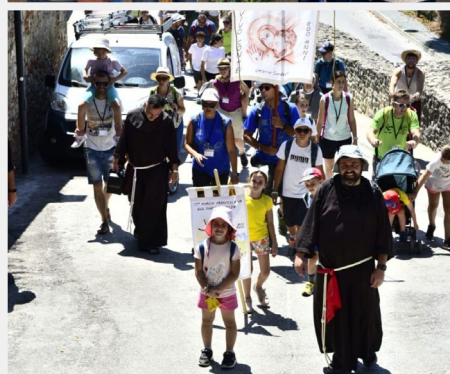
Franjevački hod obitelji, provincija Serafica sv. Franjo Asiški (Italija)