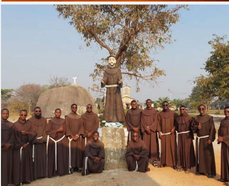
Primeira profissão dos noviços da Fundação Imaculada Mãe de Deus de Angola