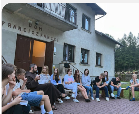
Retiro com 29 jovens em Dukla, Prov. Imaculada Conceição (Polônia)