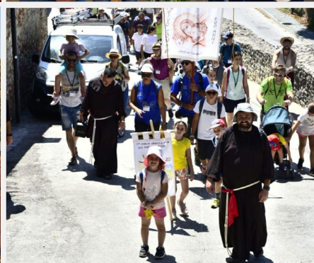
Caminhada Franciscana das famílias, Prov. Seráfica S. Francisco de Assis (Itália)