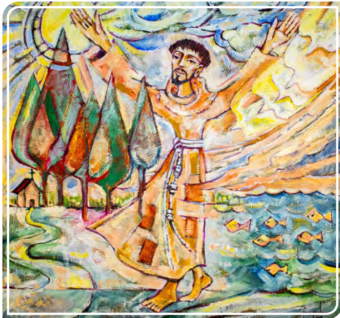
Pintura obra de Fr. Pedro da Silva Pinheiro de la Provincia Franciscana de la Inmaculada Concepción en Brasil

El 2 de febrero, la Provincia Franciscana de la Inmaculada Concepción en Brasil abrió oficialmente las celebraciones del VIII Centenario del Cántico de las Criaturas. Las 41 fraternidades situadas en los estados de Santa Catarina, Paraná, São Paulo, Río de Janeiro y Espírito Santo, así como las cinco fraternidades presentes en Angola, hicieron de esta fecha un punto de referencia con celebraciones, oraciones y actividades evangelizadoras centradas en el tema de la Alabanza a Dios por la