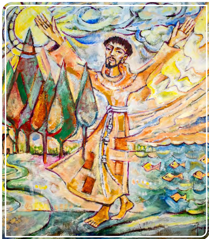
Slika fra Pedra da Silve Pinheira iz Provincije Bezgrješne

Dana 2. veljače 2025. franjevačka provincija Bezgrješnog začeca u Brazilu službeno je započela slavlje Osamstote obljetnice Pjesme stvorenja. Sve 41 bratstvo koja se nalazi u državama Santa Catarina, Paraná, São Paulo, Rio de Janeiro, Espírito Santo, uz 5 bratstava prisutnih u Angoli, učinila su ovaj datum referentnom točkom za slavlja, molitve i evangelizacijske aktivnosti usmjerene na slavljenje Boga za sve stvoreno i za dar sudjelovanja u njemu. [...]