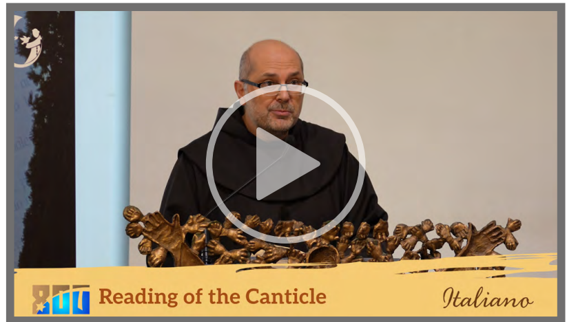
Lectura del Cántico de las Creaturas – Italiano