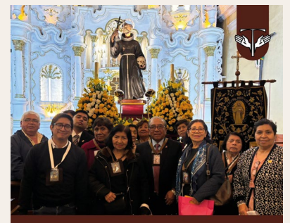
Orden Franciscana Seglar de Santiago de Surco Lima Peru