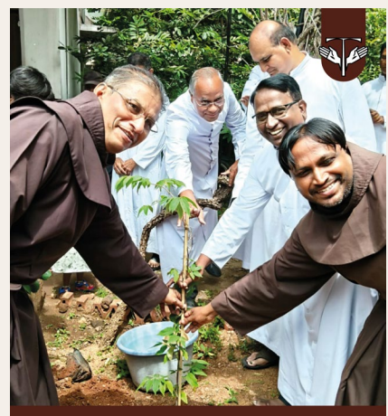
Dharmodaya Seva Ashram Bellary, India