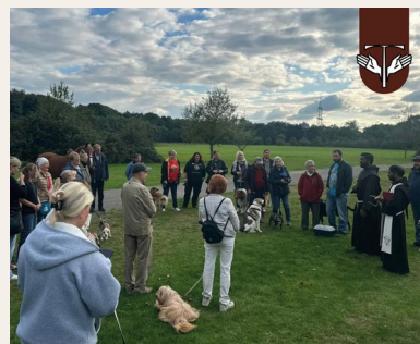
Franziskaner Kloster Cologne, Germany