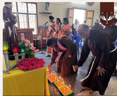
Assisillam Dindigul, India