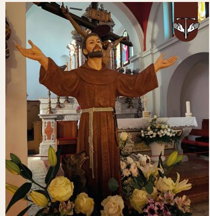
The Church and the Monastery of St Francis Split, Croatia