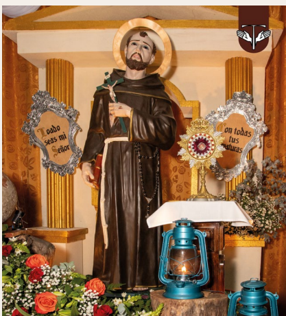
Parroquia San Francisco de Asís, Juigalpa, Chontales, Prov Nuestra Señora de Guadalupe Nicaragua