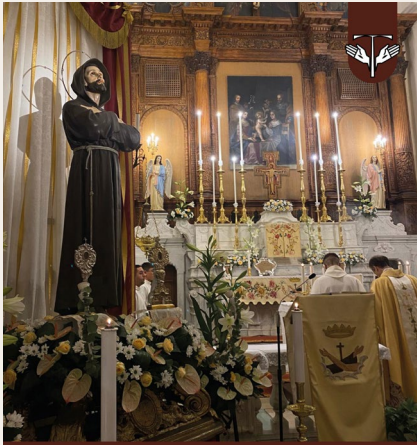
Chiesa San Francesco d'Assisi Gallipoli provincia di Lecce, Italia