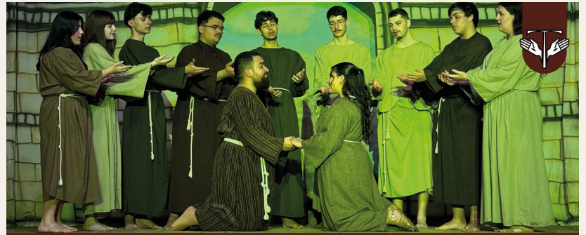
Operetta of Saint Francis of Assisi Parish of the Immaculate Conception-City of Curitiba, Santa Catarina, Brazil