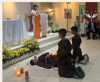
Our Lady of Guadalupe Friary Prov de los Ss Francisco y Santiago Hebbronville, Texas, USA