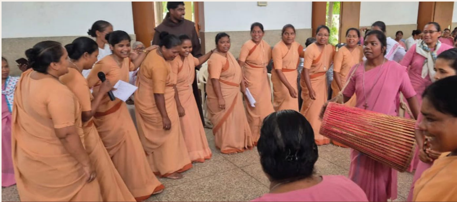
St Francis Friary Basen, India