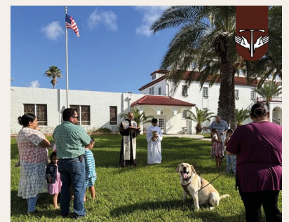
Our Lady of Guadalupe Friary Prov de los Ss Francisco y Santiago Hebbronville, Texas, USA