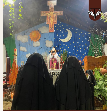
Monasterio de Santa Clara en Montenegro Quindío, Colombia, Prov San Pablo Apóstol