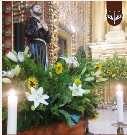
Santuario de Ntra. Sra. Santa Maria de Guadalupe Ciudad de Morelia, Michoacán de Ocampo, México