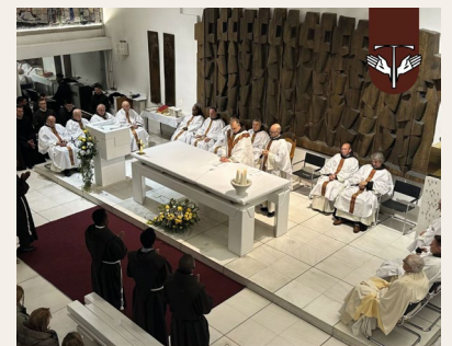
Convento di San Paolo Sarajevo, Croazia