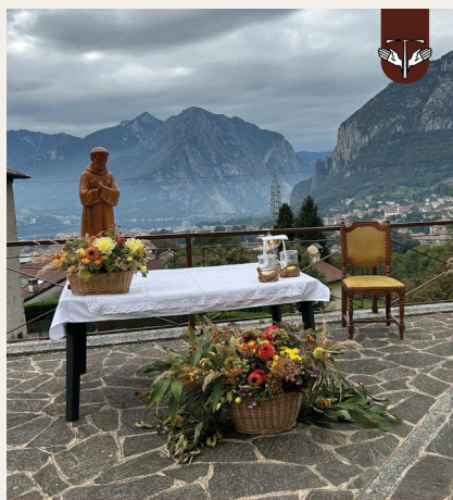
Acquate di Lecco, frazione di Falghera Italia