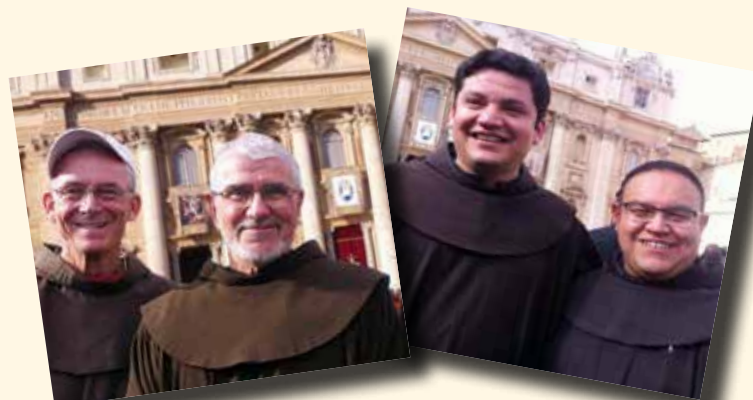
Hermanos Menores que participaron en la Eucaristía de clausura del Jubileo Extraordinario de la Misericordia (20.XI.2016).